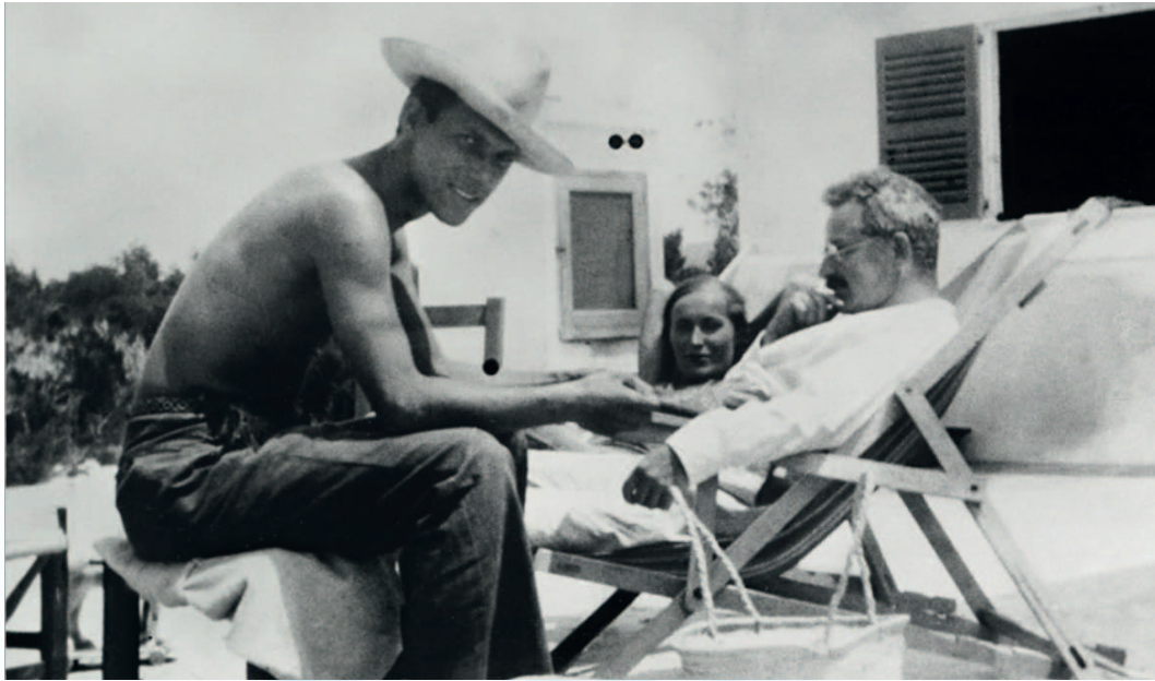
• Walter Benjamin dans sa résidence à Sant Antoni en compagnie de Jean Setz •