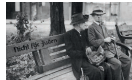
«Nicht für Juden».